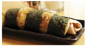
最上義光とんとん ¥300