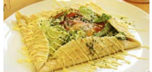
ガレット風とんとん焼き ¥680