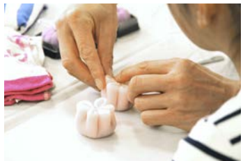
母の日のプレゼント作り