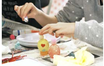
イースターエッグ作り