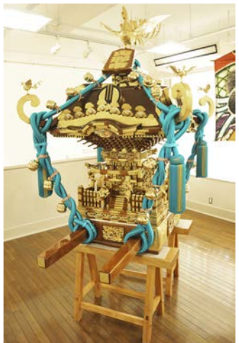
山形伝統工芸御輿

山形まなび館自主イベントのメイン会場として、新たな山形の魅力を発掘発見し、情報発信と体験の場として展開します。